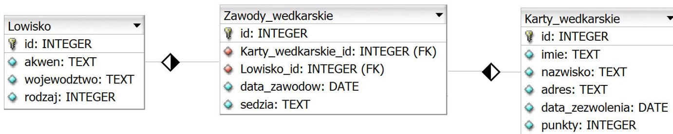
Obraz 1. Baza danych

Baza danych jest zgodna ze strukturą przedstawioną na Obrazie 1. Tabela Zawody_wedkarskie jest połączona relacją z tabelą Lowisko (opisuje łowisko, gdzie będą się odbywać zawody) oraz tabelą Karty_wedkarskie (opisuje wędkarza, który wygrał zawody). Tabela Lowisko zawiera pole rodzaj, którego wartości oznaczają: 1 – morze, 2 – jezioro, 3 – rzeka, 4 – zalew, 5 – staw.