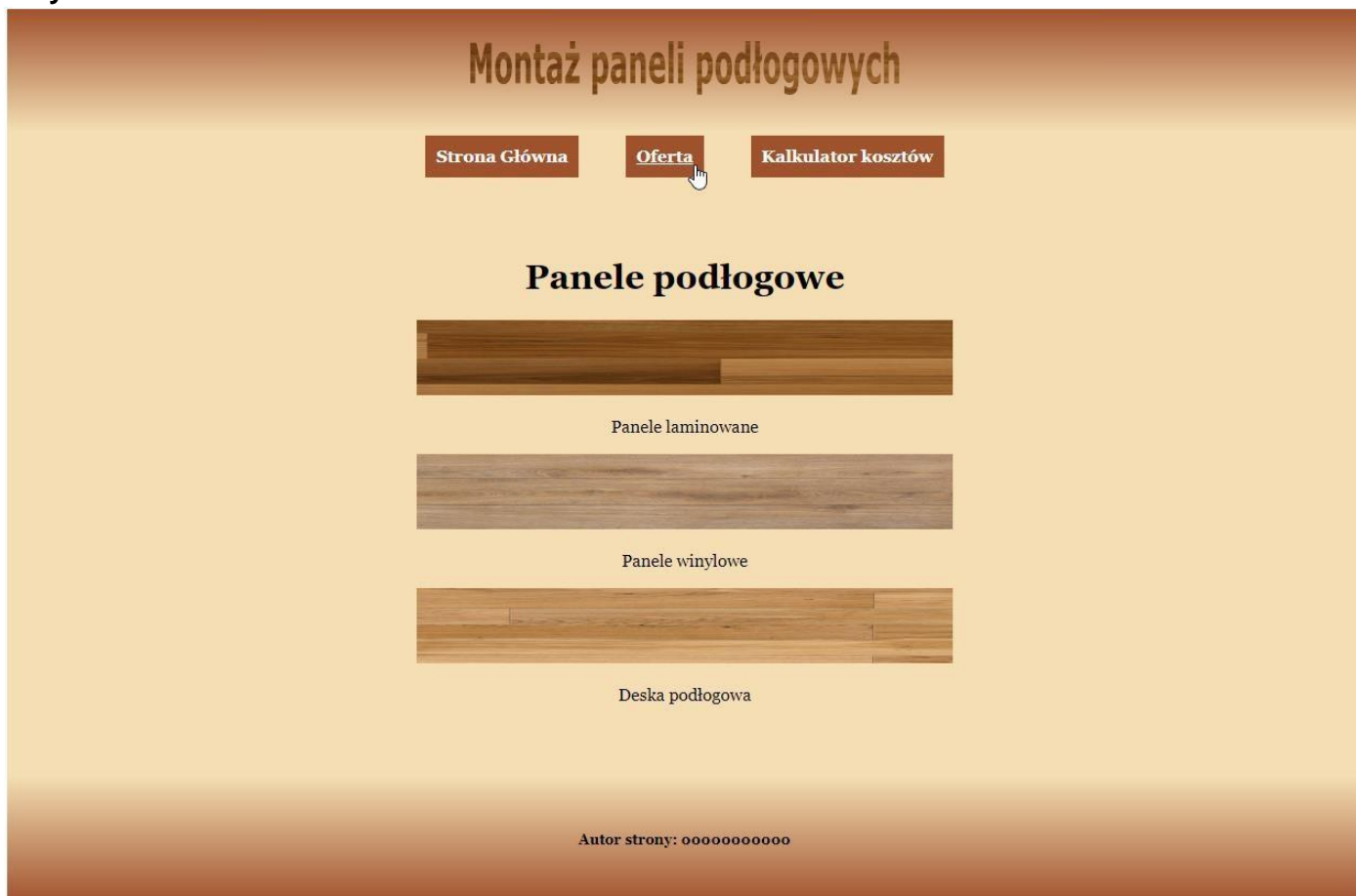
Ilustracja 3. Strona index.html , kursor na drugim odnośniku