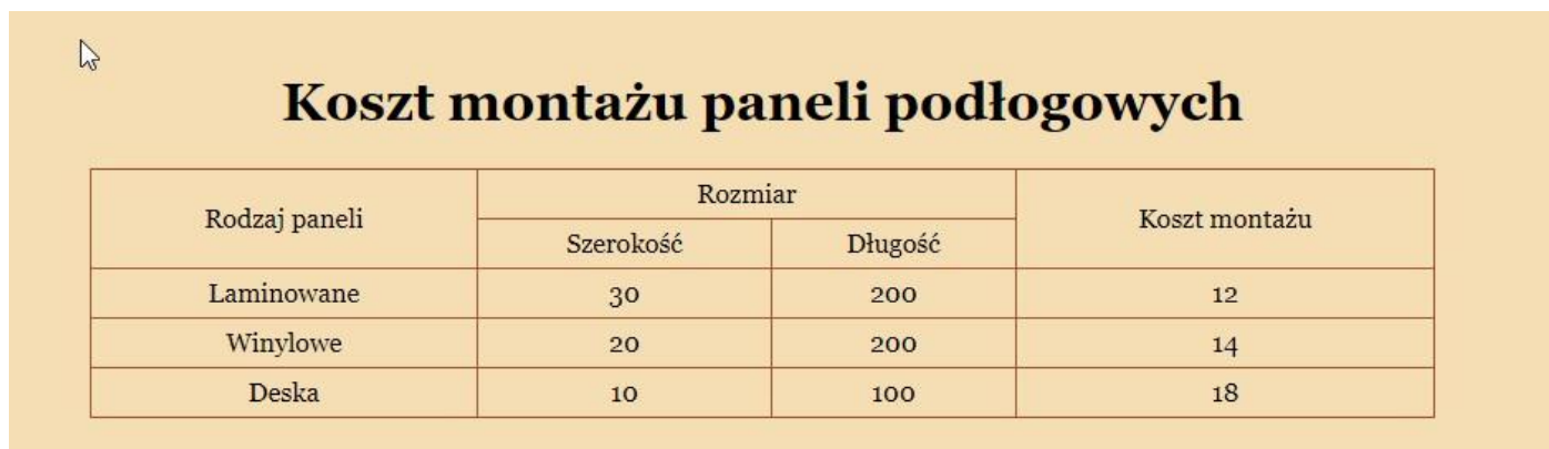
Ilustracja 4. Fragment bloku głównego strony oferta.html